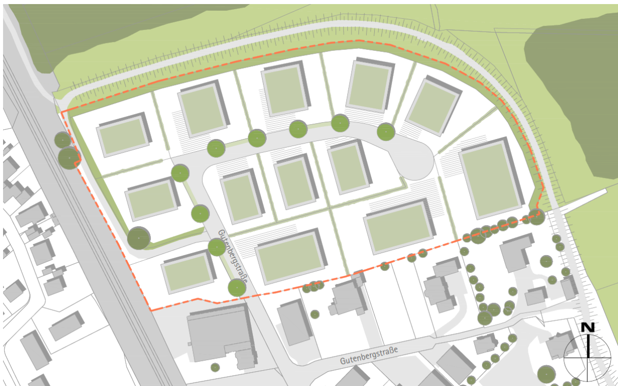
Titel: Städtebaulicher Entwurf